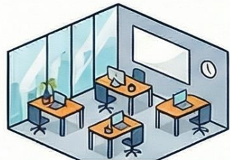
Sala Rio Tejo