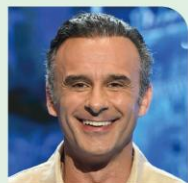
Rui Unas Ator e Apresentador Televisivo