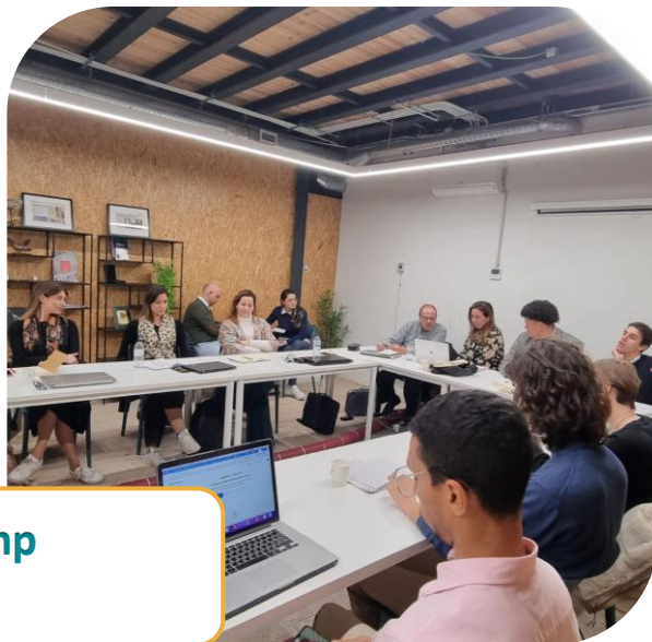
Abertura do 5º Bootcamp do Barreiro