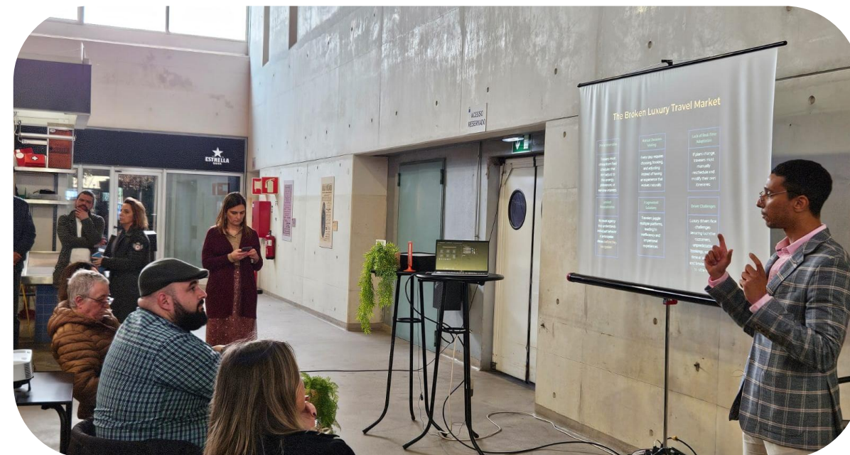
Projetos do 5º Bootcamp do Barreiro