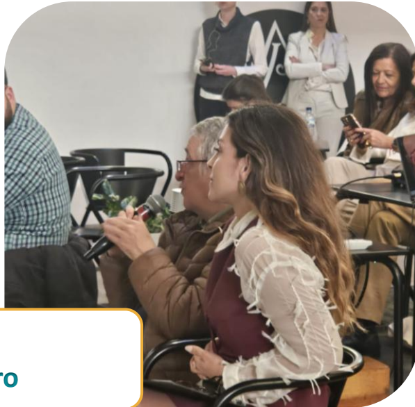
Jurados do 5º Bootcamp do Barreiro